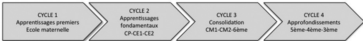
Fig. 1. – Les nouveaux cycles d'enseignement, de l'école au collège.